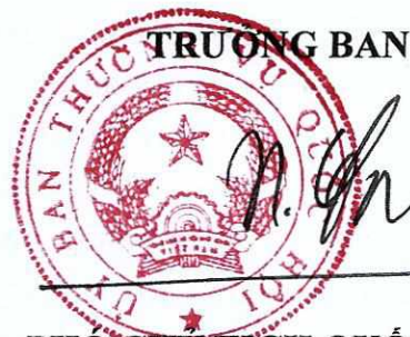
PHÓ CHỦ TỊCH QUỐC HỘI Nguyễn Khắc Định